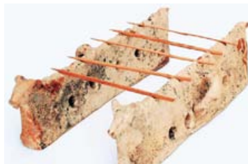
Συσκευή BBQ... από την αρχαία Θήρα!

Επίσης, οι ελιές, το λάδι και τα όσπρια (λαθούρι, μπιζέλι, φακές) καθώς και ο οίνος αποτελούσαν απαραίτητα στοιχεία της διατροφής τους. Τα ψάρια και τα θαλασσινά ήταν απεριόριστα ενώ όσον αφορά στο κρέας είχαν ιδιαίτερη προτίμηση στο κασικάκι. Πρέπει να ειπωθεί ότι υπάρχουν σοβαρές ενδείξεις ότι αγαπημένη τους συνταγή ήταν... το σουβλάκι!!!