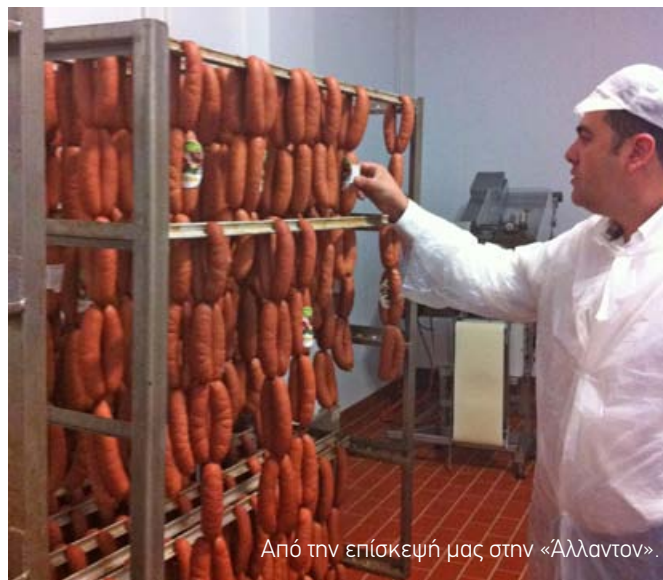
Από την επίσκεψή μας στην «Αλλαντον».

Μετά από όλες αυτές τις περιπέτειες, γύρισε στη Σαντορίνη. Τη γνώση και την εμπειρία που απέκτησε όλον αυτόν τον καιρό είναι έτοιμη πια να την μοιραστεί με τους πελάτες της.