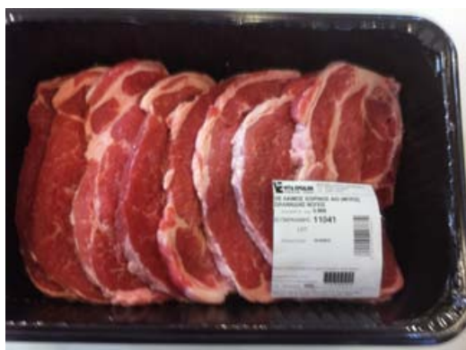
Συσκευασία του κρέατος σε τροποποιημένη ατμόσφαιρα

Ιστορικά, ο άνθρωπος προσπαθεί να βρει τα κατάλληλα μέσα και μεθόδους για να προστατέψει και να συντηρήσει την τροφή του για όλο και μεγαλύτερο χρονικό διάστημα έτσι ώστε να έχει τη δυνατότητα να την αποθηκεύει και να την καταναλώνει όταν τη χρειαστεί. Έτσι, έχει εφεύρει μεθόδους συντήρησης όπως είναι το αλάτισμα (πάστωμα), η αφυδάτωση, η ψύξη και η κατάψυξη. Η συσκευασία είναι μια τέτοια μέθοδος καθώς απομονώνει το τρόφιμο από τους περιβαλλοντικούς παράγοντες οι οποίοι το επηρεάζουν (ξένα σώματα, μικροβιακή αλλοίωση, κλπ). Αυτό έχει ως αποτέλεσμα την προστασία του τροφίμου από εξωγενείς παράγοντες που προκαλούν επιμόλυνση και την επιμήκυνση του χρόνου ζωής ενός τροφίμου σε σχέση με κάποιο ίδιο που δεν βρίσκεται σε συσκευασία.